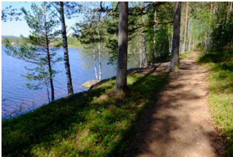
"Kärleksstigen" i Lekvattnet.

Samtliga "hytter" som det heter på bokningssajternas hemsidor ligger avsides med tallskog inpå knutarna och naturen som närmaste granne. Det är ett par hundra meter mellan varje stuga, skrev NWT i en tidigare artikel.