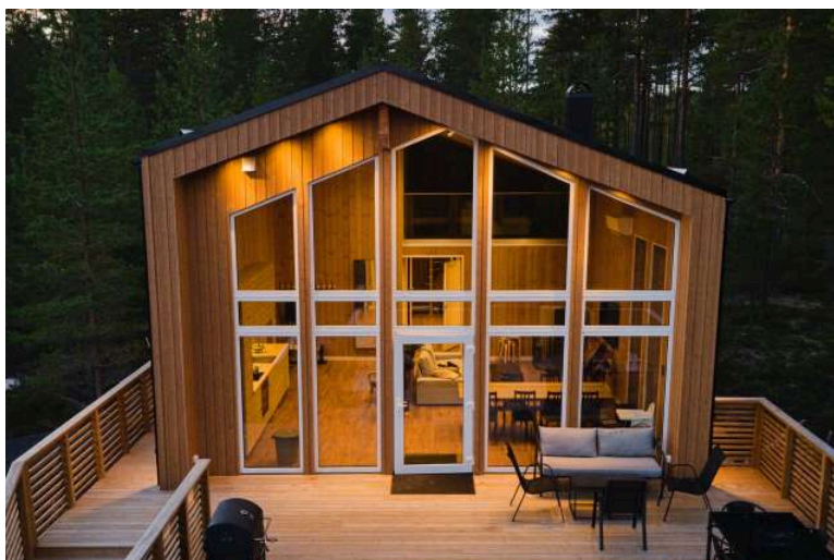
Ett av husen vid Unike Finnskogen i Lekvattnet. Liknande stugor kan det bli i nya stugbyn.

"Vi vill lämna information om förslaget och inhämta synpunkter", skriver Torsby kommun i sin inbjudan.